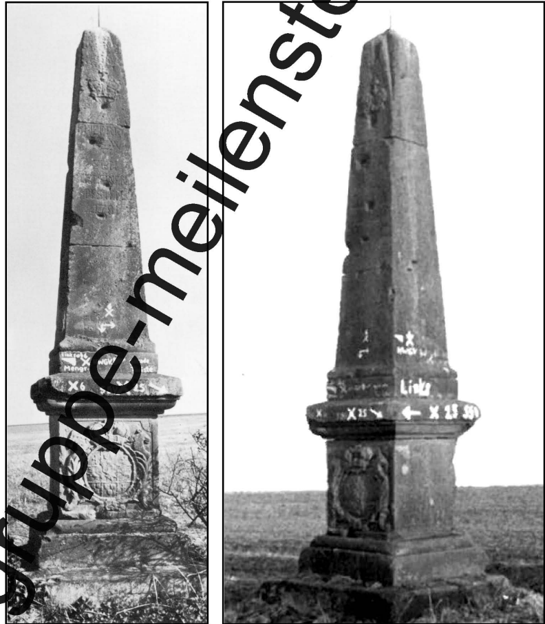
Abb. 1 und 2: Historische Aufnahmen der Stundensäule Twiste aus der Zeit vor 1981. Offensichtlich wurde es aber zu vergleichbarer Zeit wie Abb. 1 aufgenommen.

Deshalb nun ein kurzer Exkurs in die Geschichte: Das Land Waldeck entstand im Mittelalter um die Burg Waldeck an der Eder im Nordwesten des heutigen Landes Hessen als selbständige Grafschaft des Heiligen Römischen Reiches. 1712 wurde es zum Fürstentum mit der Residenzstadt Arolsen (heute Bad Arolsen), das zudem von 1848 bis 1921 staatsrechtlich mit der Grafschaft Pymont zu Waldeck-Pymont vereinigt war. Die Waldecker Grafen und Fürsten entstammten dem Haus Waldeck. Infolge der Novemberrevolution von 1918 wurde aus dem Fürstentum ein Freistaat. 1921 wurde Pymont wieder abgetrennt und in Preußen eingegliedert; der verbliebene Freistaat Waldeck wurde 1929 durch Eingliederung in die preußische Provinz Hessen-Nassau aufgelöst. In der für die Aufstellung der Stundensäule bei Twiste relevanten Zeit, nämlich von 1775 bis 1783, regierte Fürst Friedrich Karl August. (2)