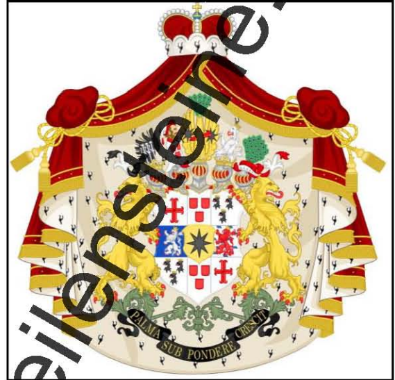
Abb. 6 (links): Das Wappen am Postament der Stundensäule bei Twiste.