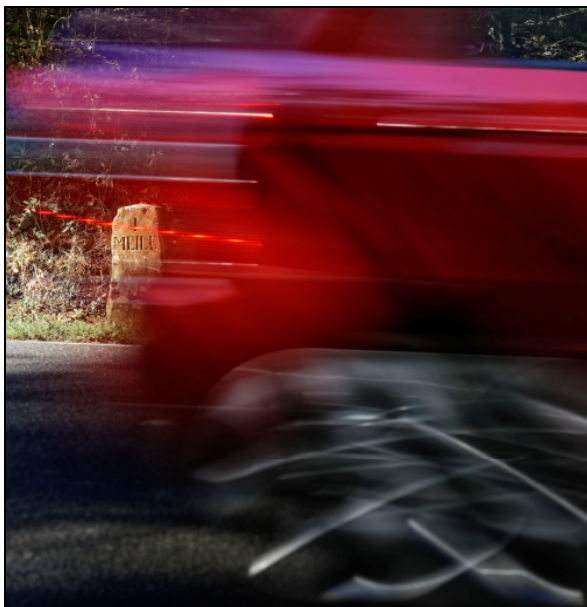
Alter Meilenstein – schnelles Auto, hannoverscher Ganzmeilenstein Diekholzen

© Nachdruck, auch auszugsweise, oder jedwede andere Form der Vervielfältigung nur mit Zustimmung des Herausgebers gestattet. Übernahme ins Internet ist nicht gestattet.